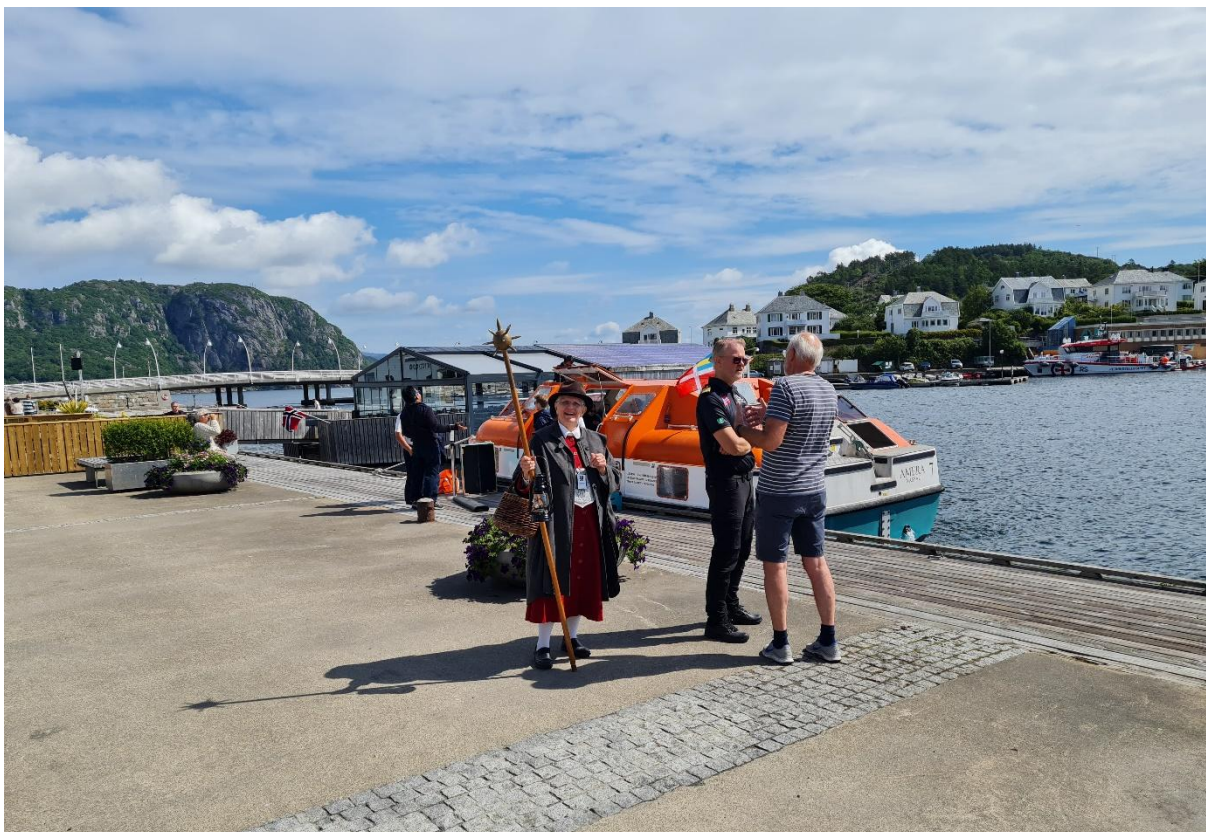
Figur 2 Cruiseanløp

I 2025 ble det avholdt to representantskapsmøter og 7 saker ble behandlet, blant annet fastsettelse av årsregnskapet og årsberetningen, vedtakelse av selskapets budsjett, økonomiplan og prisliste.