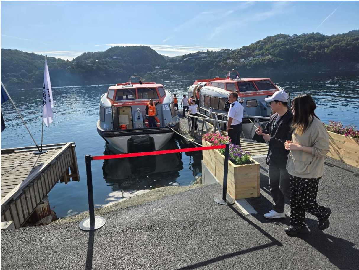
Figur 16 Tenderbåter for cruisepassasjerer langs flytebryggen på Holmsundet.

Listerhavnene IKS hadde 3 cruiseanløp i 2025. Skipet Renaissance ankret opp i havnebassenget i Farsund 17. mai. Med et passasjerantall på 1498 og en besetning på 602. MSC Poesia ankret opp i Rosfjorden 10 juli med 2990 passasjerer og en besetning på 1039.