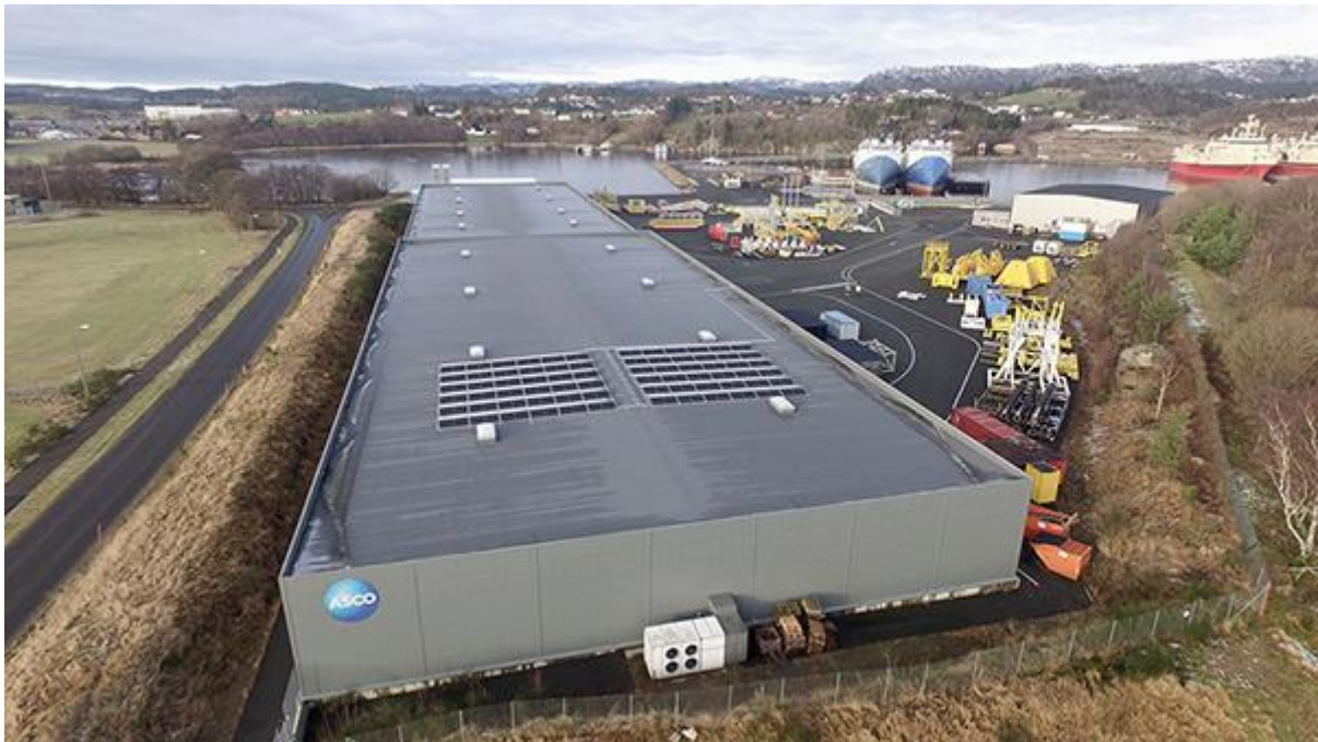
Figur 7 Solcellepanel hos ASCO Norge AS, avd. Farsund