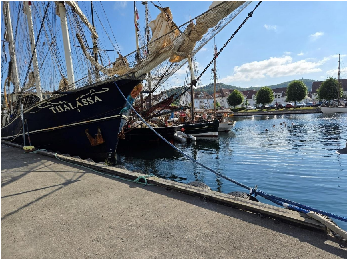
Figur 5 Tall Ship Race båter på besøk i Farsund sommeren 2025

Listerhavnene IKS tilbyr landstrøm til fartøy for å redusere både støy og utslipp. I 2025 mottok 15 fartøy, samt lekteren Over, ulike arrangementer på Torvet og Jansens plan (Farsund) landstrøm.