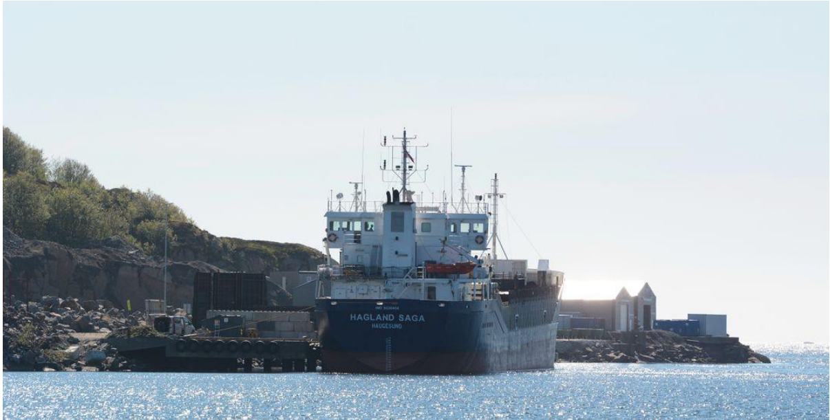
Figur 14 Hausvik havneanlegg

Bulk omfatter både tørr- og våtbulk. Stein og grus, tømmer, råvarer til Alcoa og asfalt er eksempler på tørrbulk som håndteres, mens eksempler på våtbulk er flytende naturgass (LNG) og marin gassolje (MGO).