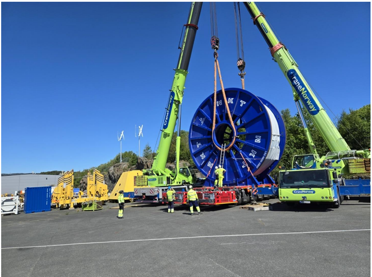
Figur 4 Samløft

Selskapets visjon «Mulighetenes havn» har lik betydning for mennesker involvert, for kunder og for brukere i havnen. I tråd med selskapets visjon og verdier arbeider Listerhavnene IKS langsiktig for å etablere mangfold og gi personer muligheter, uavhengig av sitt opphav.