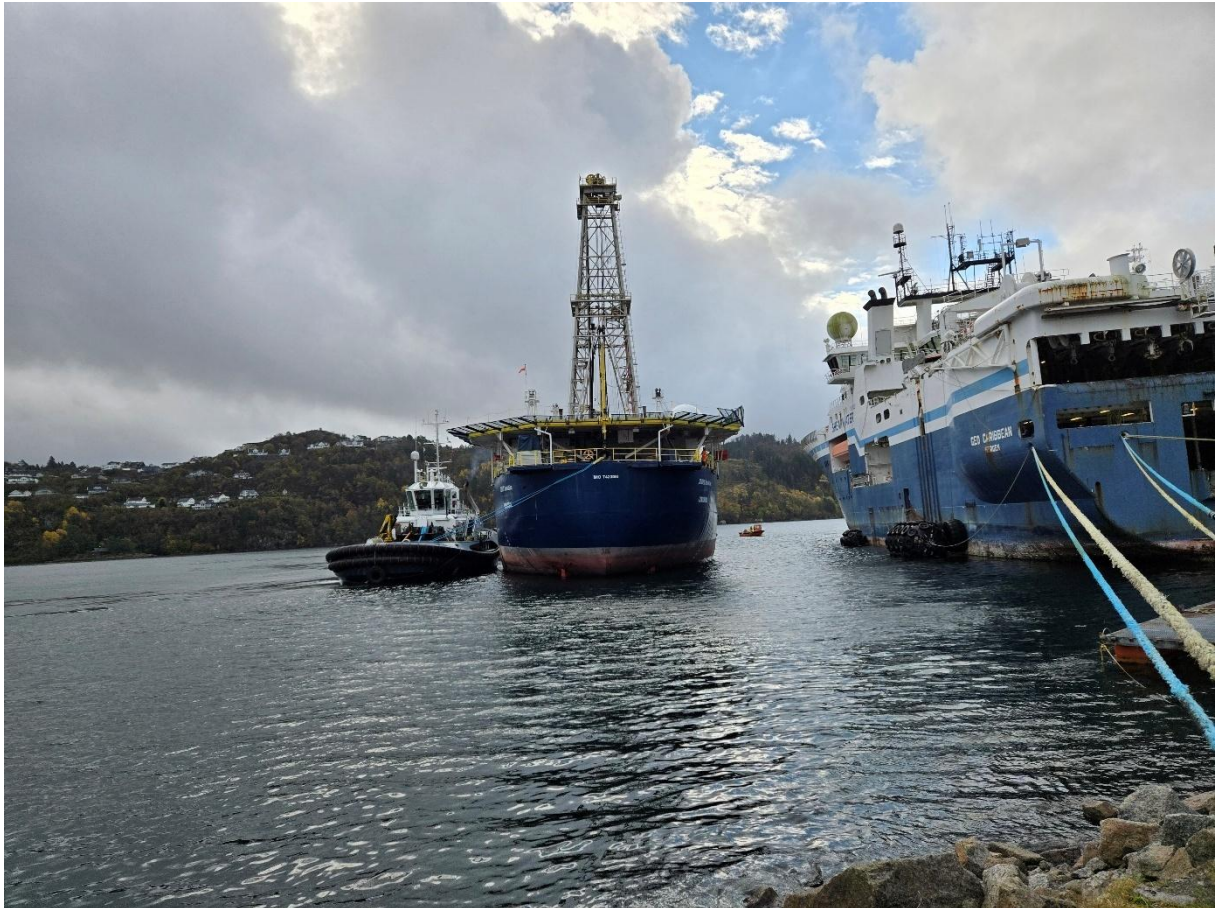
Figur 18 Joides Resolution blir fortøyd for opplag ved Holmsundet terminal

Mobilisering og demobilisering av fartøy som benyttes i offshoreprosjekter er en av flere aktiviteter relatert til offshore. Listerhavnene IKS har få slike prosjekter i 2025. Etter noen år med flere seismikkskip i opplag, der 2023 var et toppår for seismisk aktivitet i havnen, var 2025 et mer normalt år. Aktiviteten i 2025 var tilnærmet lik som i 2024.