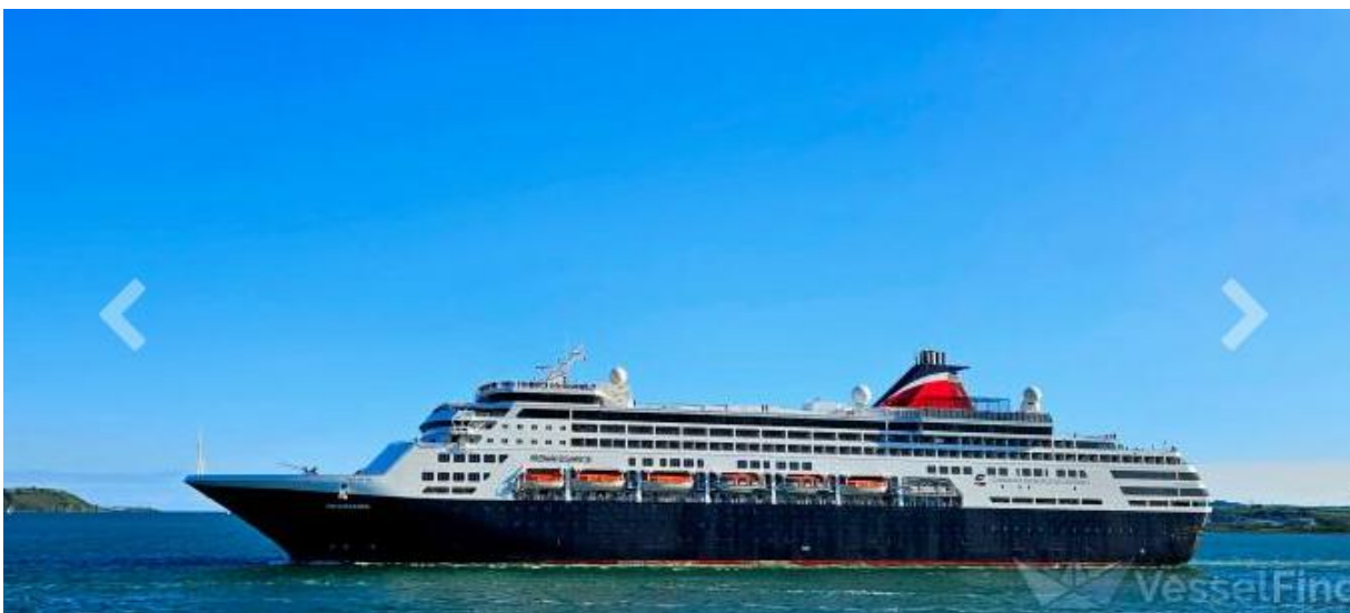
Figur 17 Renaissance.

Listerhavnene IKS hadde 3 cruiseanløp i 2025. Skipet Renaissance ankret opp i havnebassenget i Farsund 17. mai. Med et passasjerantall på 1498 og en besetning på 602. MSC Poesia ankret opp i Rosfjorden 10 juli med 2990 passasjerer og en besetning på 1039.