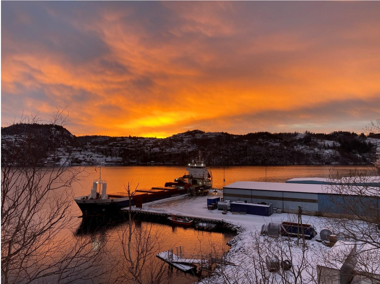
Figur 6 Soloppgang for grønn energi