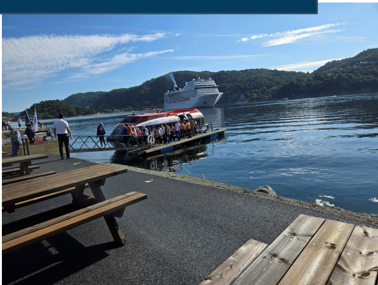
Figur 1 MSC Poesia til ankers i Rosfjorden 10.07.2025