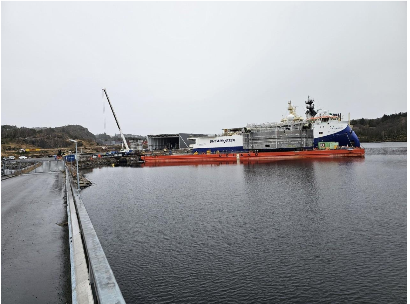
Figur 11 Tank for landbasert oppdrett ankommer Barings anlegg i Lundevågen i Farsund.

Listerhavnene IKS forvalter fire fiskerihavner i tillegg til fiskemottak i Borshavn. Totalt er det i overkant av 30 fiskefartøyer som leier kai plass av selskapet.