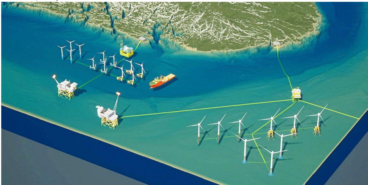
Figur 9 Planlagte havvindparker Nordsjøen

Det er planlagt å bygge 2000 vindmøller på norsk sokkel, med ambisjoner å oppnå 30 gigawatt innen 2040. To områder for havvind ble åpnet på norsk sokkel den 1. januar 2021, Utsira Nord og Sørlige Nordsjø II. Områdene legger til rette for en produksjons-kapasitet på 4,5 gigawatt, tilsvarende strøm til ca. en million husstander. Mange av møllene skal plasseres geografisk nært Listerregionen, som dermed åpner et gigantisk marked for regionens bedrifter. Listerhavnene IKS vil bidra med å tilrettelegge for at Agder kan ta en ledende posisjon innen havvind.