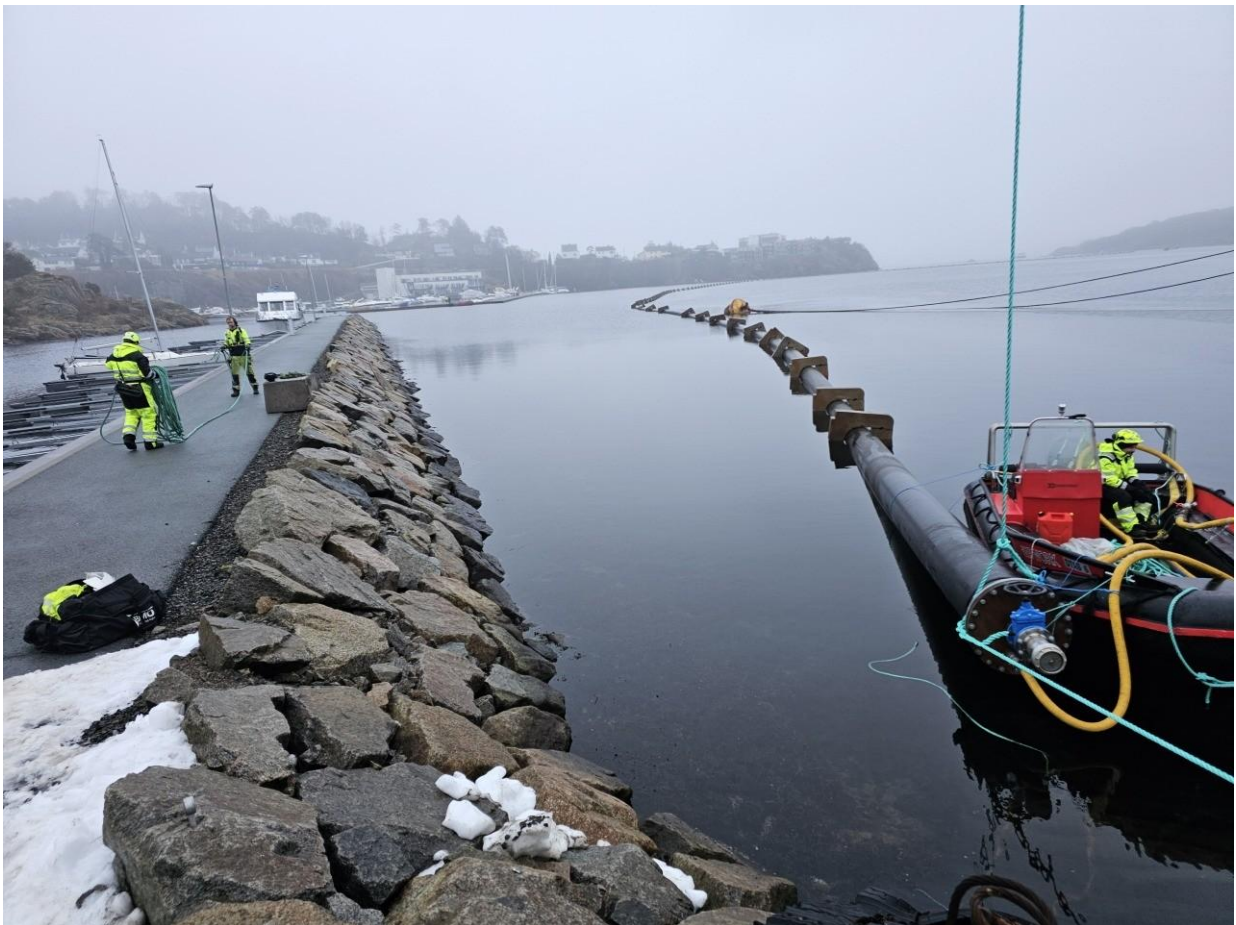
Figur 10 Utlegging av sjøvannsledninger for Baring i Lundevågen i Farsund.

Oppdrettsnæringen i Listerregionen er verdensledende på sine områder. Listerhavnene IKS skal bidra etter beste evne for å støtte og utvikle areal til landbasert oppdrett slik som på Hausvik. Det pågår omfattende forskning, utprøving og produksjon av fisk / marine arter på Hausvik industriområde. Her er veksten, og vekstpotensialet betydelig fremover, sammen med landbasert fiskeoppdrett i Lundevågen og på flyplassen i Farsund.