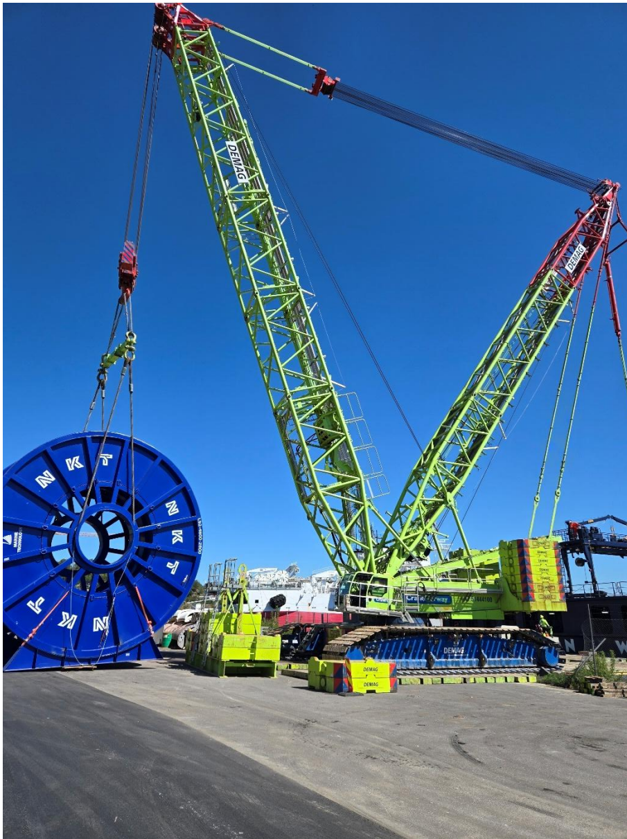
Figur 3 Tungløftskran heiser i land kabeltrommel på dypvannskaien i Farsund.