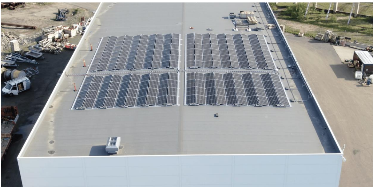
Figur 8 Solcellepanel hos FFS Marine AS